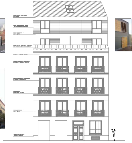
ALZADO FACHADA. CALLE ESPIRITU SANTO